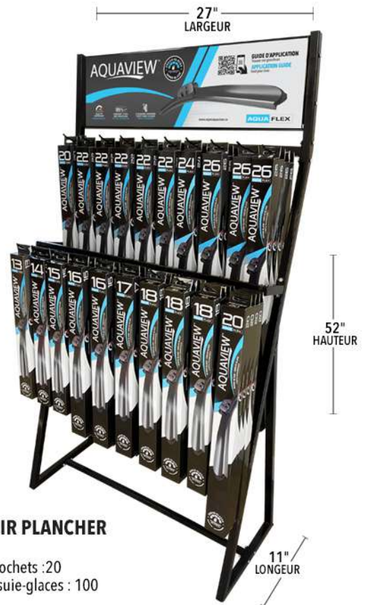
PRÉSENTOIR PLANCHER WR2080FL Nombre de crochets : 20 Quantité d'essue-glaces : 100