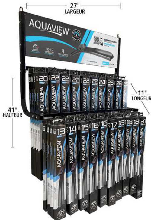
PRÉSENTOIR MURAL WR2080W Nombre de crochets : 20 Quantité d'essue-glaces : 100