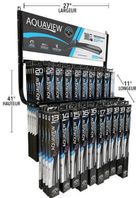
PRÉSENTOIR MURAL WR2080W Nombre de crochets : 20 Quantité d'essuie-glaces : 100