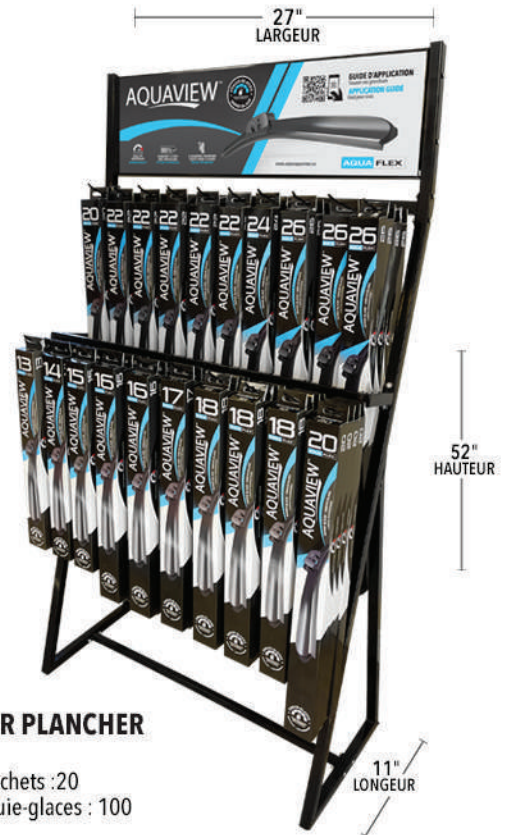
PRÉSENTOIR PLANCHER WR2080FL Nombre de crochets : 20 Quantité d'essuie-glaces : 100